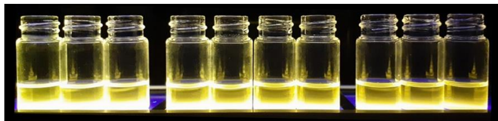
溶媒によって発光の強さが変化する色素