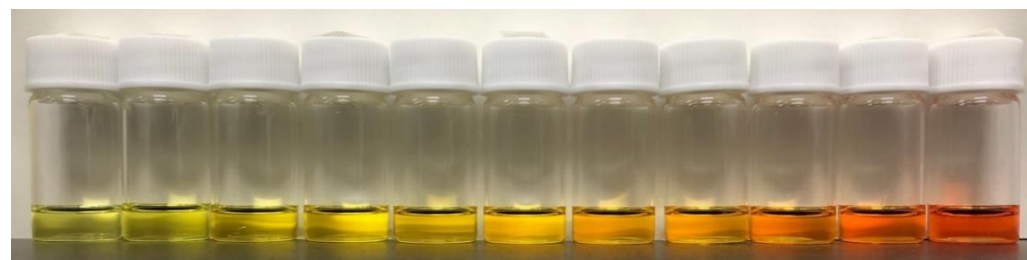
溶媒によって色が変わる色素

オリジナル有機色素の開発を通して、新しい分子の設計・合成・評価の技術を修得します。