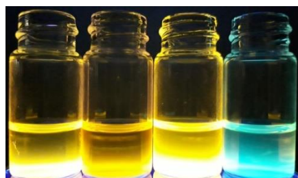
pH で発光色が変わる色素