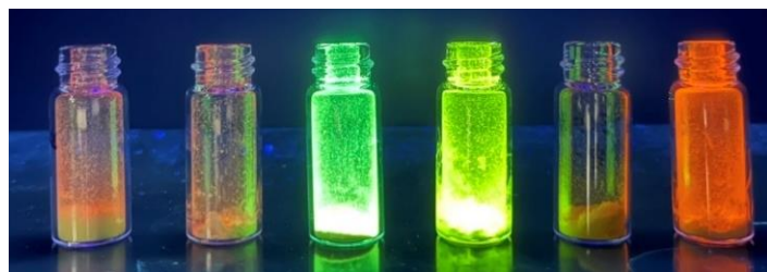
固体でまばゆく発光する色素