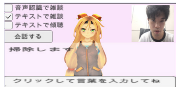
図 4 雑談会話機能の実行例 2

エージェントの雑談会話機能の実行例を図 3 と図 4 で、会話ログ保存機能の実行例を図 5 で示す。図 3 で