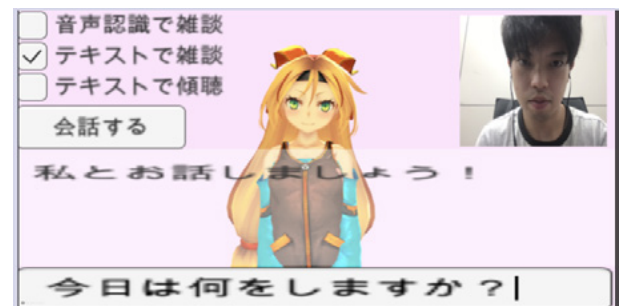
図 3 雑談会話機能の実行例 1

動作実験の結果、三つの結果を得ることができた。まず一つ目は、エージェントによる雑談と傾聴応答機能によりユーザーと簡単な会話が可能になったことである。続いて二つ目は、ユーザーの表情画像から感情分析し、それに合わせたエージェントの応答が可能になったことである。最後に三つ目は、会話ログを CSV 保存することにより、ユーザーの情報収集が可能になったことである。